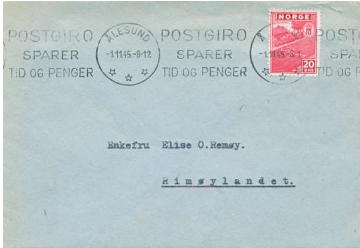
Maskinstempel med tekst brukt 1. november 1945.