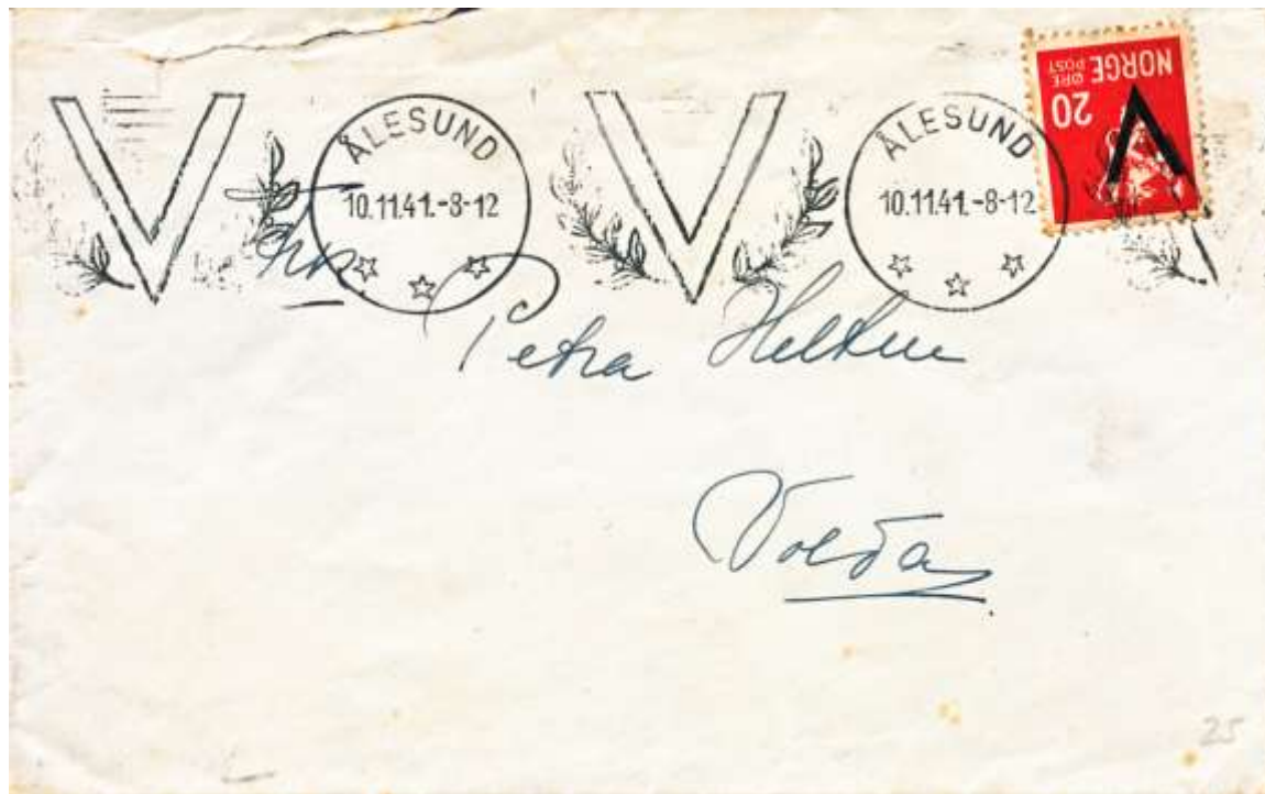
Maskinstempel med tekst brukt 10. november 1941.

Det skal ha vært registrert 66 maskiner på dette tidspunktet.